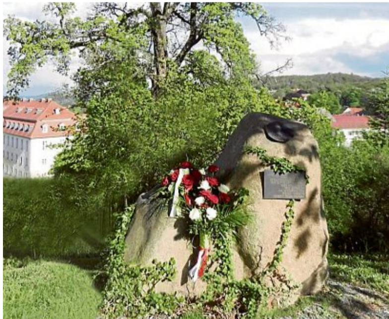
An Herzog Joachim Ernst von Anhalt erinnert in Ballenstedt ein Gedenkstein.

legte, als Heinrich Himmler, Reichsführer der SS, im Zweiten Weltkrieg das Barockschloss Dornburg an der Elbe zum KZ umbauen lassen wollte. Wie die Geschichte zeigt, hat Himmler seinen Willen durchgesetzt. Aber die „Aufsässigkeit“ des Adligen missfiel Himmler, dem neben Hitler einflussreichsten NS-Machthaber, außerordentlich. Als bekannt wurde, dass sowjetische Kriegsgefangene und Zwangsarbeiter, die im Ballenstedter Forst arbeiten mussten, zu ihren Rationen durch die herzogliche Schlossküche beköstigt worden waren, obwohl das strengstens verboten war, gab es eine Handhabe gegen Herzog Joachim Ernst. Unter dem Vorwand, der „adlige Schlossherr“ hätte einen „kommentwidrigen Exzess“ begangen, folgte am 14. Januar 1944 unter größter Geheimhaltung seine Einweisung in das Konzentrationslager Dachau.