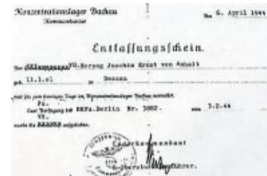
Entlassungsschein aus dem KZ Dachau

Eine Basis für eine gute Zusammenarbeit? Warum sollte daher die herzogliche Familie in den Westen fliehen, da doch Anhalt ihre angestammte Heimat war. Der Herzog vertraute der Besatzungsmacht. Doch es kam anders. Nach dem Abzug der US-Armee und mit Einzug der Roten Armee Anfang Juli 1945 in Anhalt, fu-